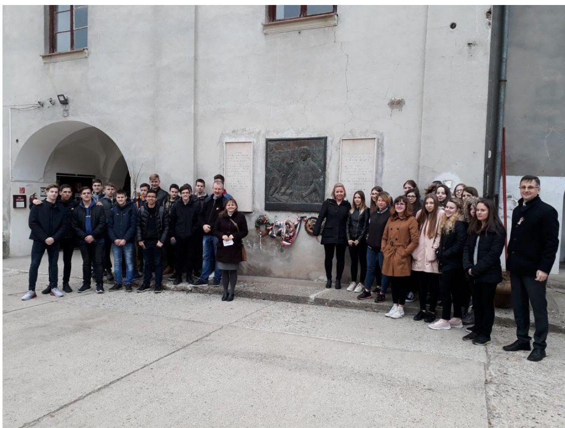
2019. március 18. Az ipolysági és aszódi diákok közös várlátogatása Szlovákiában